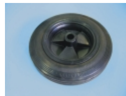
Vollgummirad Ø 250 mm