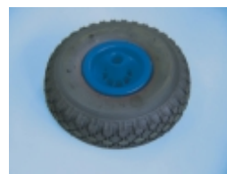
Luftrad Ø 260 mm